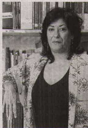
Almudena Grandes.

argentino César Aira. Alfaguara publicará, además, Claraboya , el libro perdido de José Saramago, escrito en 1953, pero perdido por su editor; quien lo encontró casi 40 años después, pero el nobel portugués ya no quiso publicarla en vida.