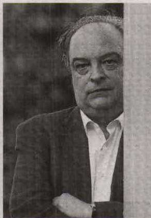
Enrique Vila-Matas.